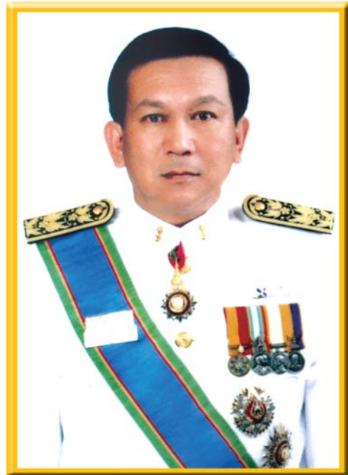
พันตำรวจเอกโกศพิบูลย์ โปตระนันทน์ รองอธิบดีกรมราชทัณฑ์ ฝ่ายปฏิบัติการ